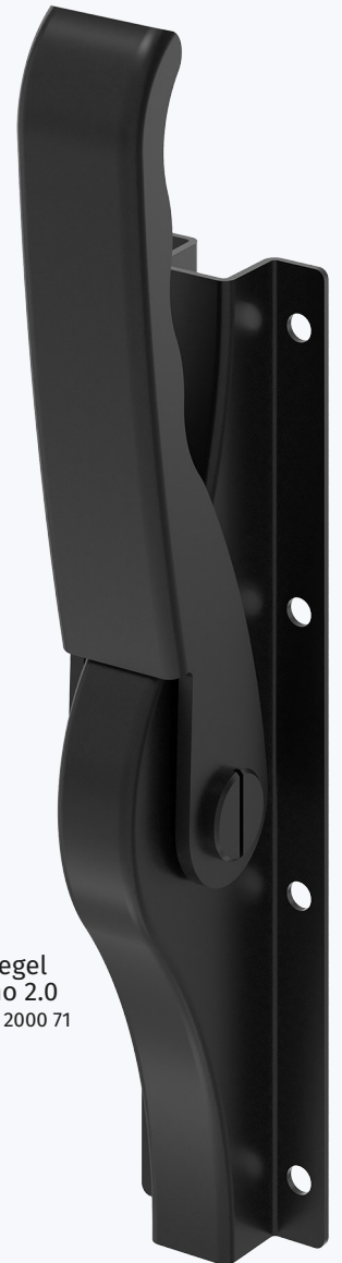
Tortreibriegel DENI Plano 2.0 Art.-Nr. 4013 2000 71